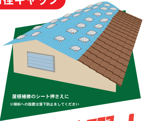
屋根補修のシート押さえに ※傾斜への設置は落下防止をしてください