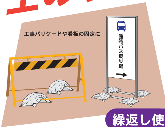
工事バリアードや看板の固定に