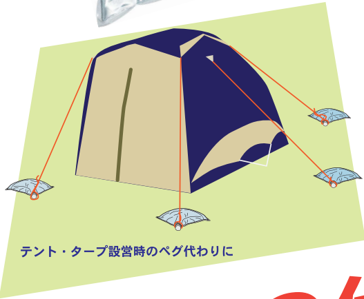
テント・タープ設置時のペグ代わりに